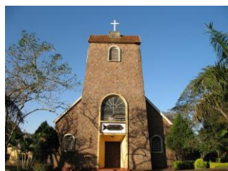
Igreja São Rafael