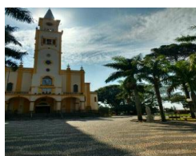
Igreja Matriz São José